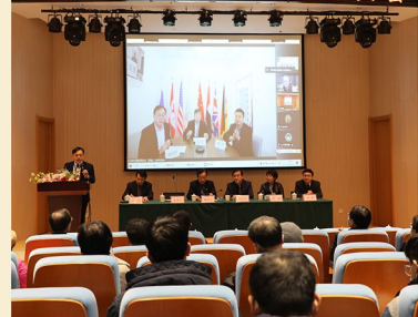
WEDA 泌尿外科联盟成立大会

青岛滨海学院附属医院自2020年6月开诊以来，秉承“除疾润心、济泽众生”的办院宗旨，把科技强院、人才兴院放在首位，十分注重学科建设、科学研究、学术交流、人才引进和培养工作，制定了《2021-2025年科教工作五年规划》和《2021年科教工作计划》，描绘了医院广阔的科教发展蓝图，进一步凝聚科学精神、拓宽研究视野、完善发展机制，坚持每周四下午召开全员学术交流会，以实际行动吹响了建设百年名院的“冲锋号”。